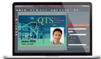
Personalisierungssoftware für Karten Evolis Badge Studio®+ (für den Import aus Datenbanken)